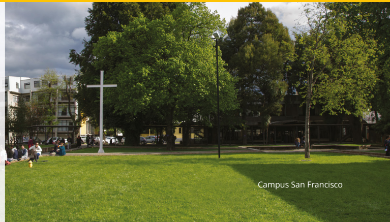
Campus San Francisco